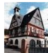
Museumsverein Burg Tannenberg