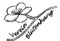
Verein zur Förderung der Obstgarten und Land- schaftskultur Blütenhang Seeheim und Malchen e.V.